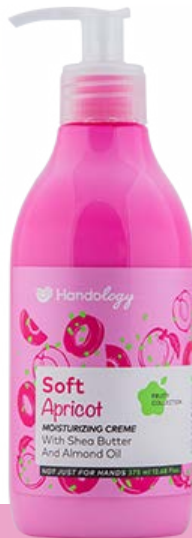
SOFT APRICOT رایحه‌ی میوه‌ای و شیرین زردآلو