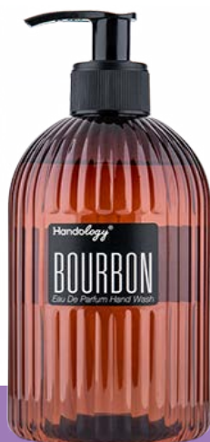
BOURBON رایحه‌ی چوب و گریپ‌فروت