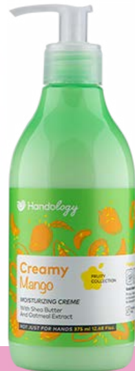
CREAMY MANGO رایحه‌ی گرم و انرژی‌زای انبه