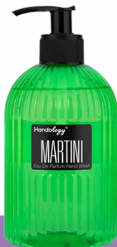
MARTINI رایحه‌ی مرکباتی لیمو و چوب سدر