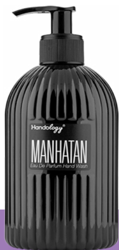
MANHATTAN رایحه‌ی مرکبات و چوب