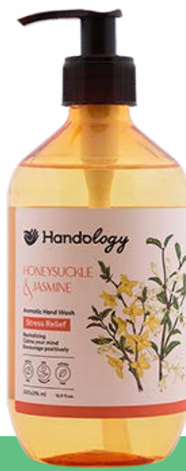
HONEYSUCKLE & JASMINE رایحه‌ی یاسمن و پیچ امین‌الدوله