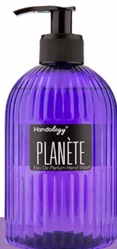
PLANÈTE رایحه‌ی عنبر سیاه و نعناع هندی