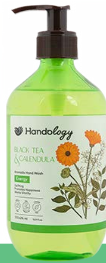
BLACK TEA & CALENDULA رایحه‌ی چای سیاه و گل همیشه بهار