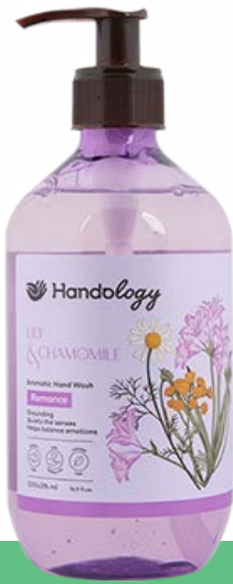
LILY & CHAMOMILE رایحه‌ی زنبق بنفش و بابونه