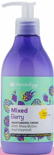
MIXED BERRY رایحه‌ی میوه‌ای و شیرین توت‌ها و بری‌ها